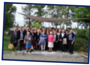
Club des Griffons