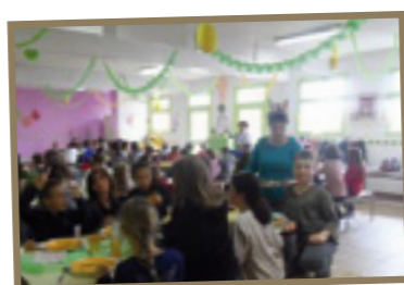
Association cantine scolaire