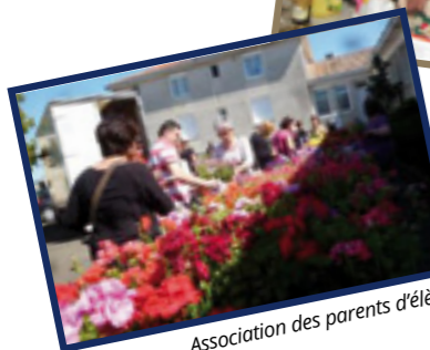
Association des parents d'élèves