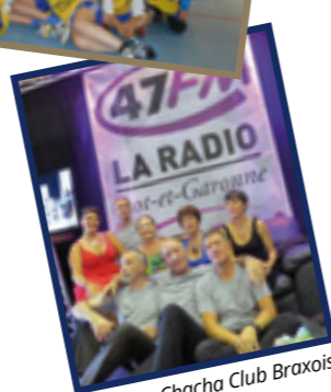
Chacha Club Braxois