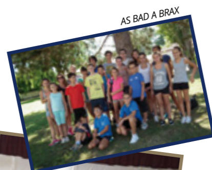
AS BAD A BRAX