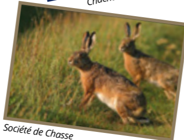
Société de Chasse