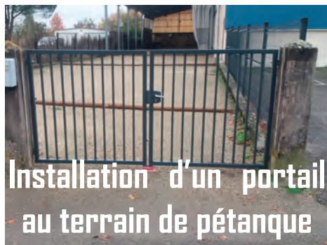
Installation d'un portail au terrain de pétanque