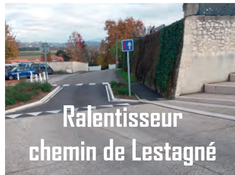
Ralentisseur chemin de Lestagné