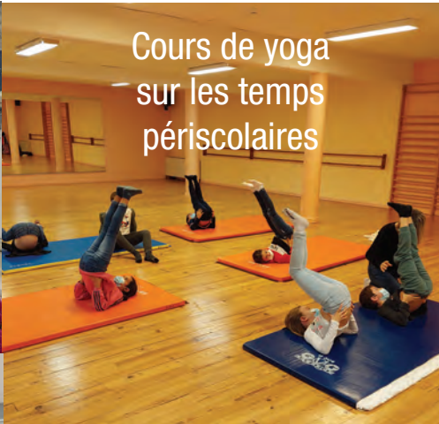
Cours de yoga sur les temps périscolaires