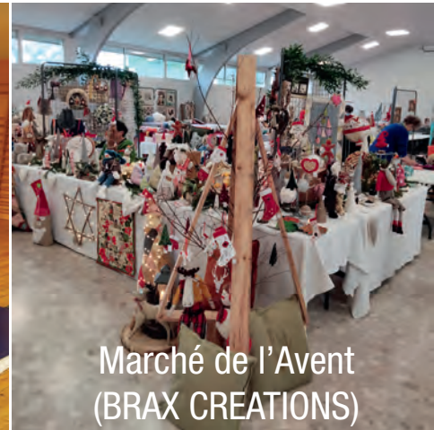
Marché de l'Avent (BRAX CREATIONS)