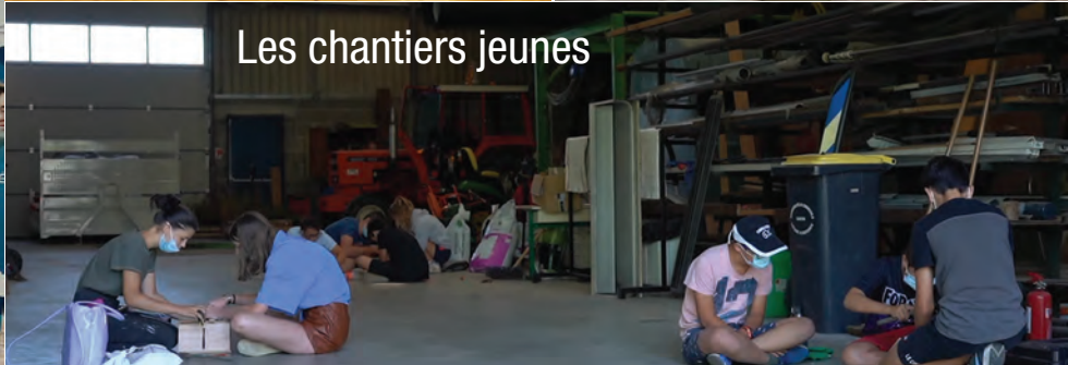
Les chantiers jeunes