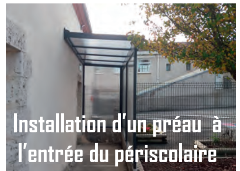
Installation d'un préau à l'entrée du périscolaire