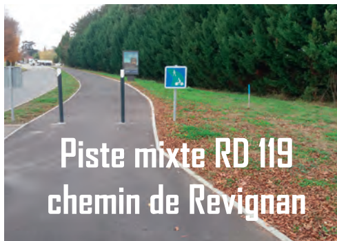
Piste mixte RD 119 chemin de Revignan