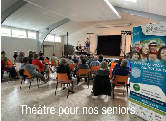
Théâtre pour nos seniors