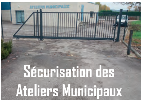
Sécurisation des Ateliers Municipaux